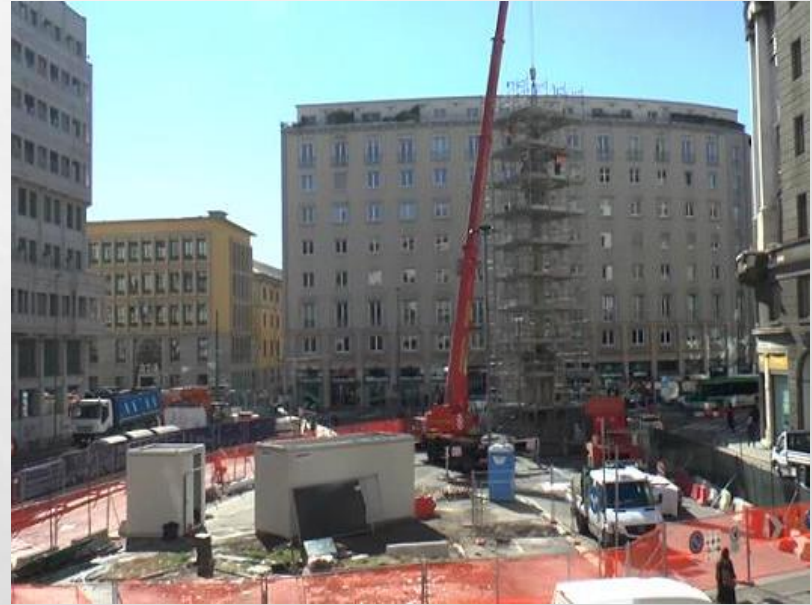
La «Crocetta di San Carlo», l'alta colonna volta in mezzo alla piazza