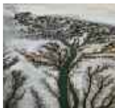
Delta del fiume Colorado n.2 San Felipe, Bassa California, Messico 2011

Promosso da UTILITALIA in occasione di EXPO 2015, in collaborazione con Comune di Milano, MM Spa e Gruppo CAP, con il patrocinio del Ministero dell'Ambiente, della Regione Lombardia, di Città Metropolitana di Milano, di EurEau, e di Wwap - Unesco.